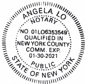
Stamp, Notary Public

LANGUAGE AND TECHNOLOGY SOLUTIONS FOR GLOBAL BUSINESS