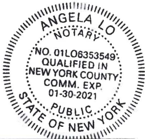
Stamp, Notary Public

LANGUAGE AND TECHNOLOGY SOLUTIONS FOR GLOBAL BUSINESS